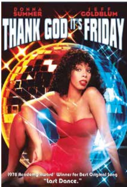
Figura 12: Thank God it's Friday ("Gracias a Dios que es viernes") es una película de 1978 dirigida por Robert Klane y producida por Motown Productions y Casablanca Filmworks para Columbia Pictures . Producida en pleno furor por la música disco, presenta a estrellas de la música disco como The Commodores y Donna Summer , cuya canción Last Dance ganaría el Oscar a la mejor canción ese año.