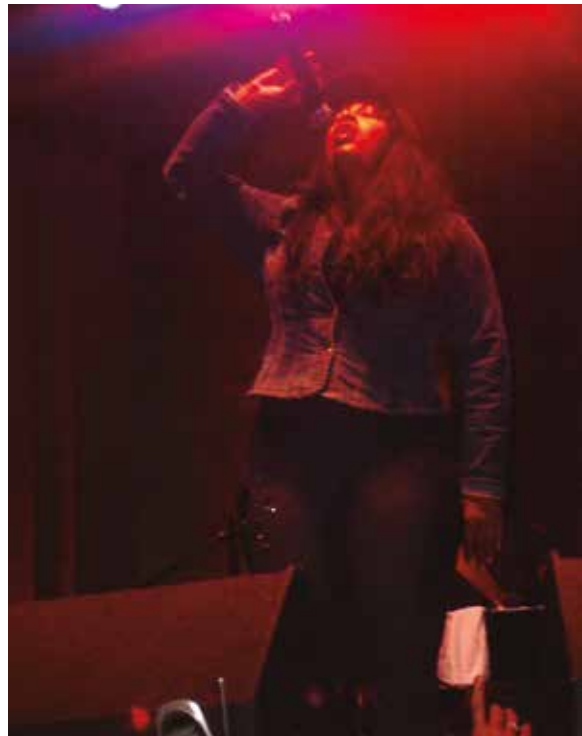
Figura 38: Donna Summer cantando en 2005.

Is the Healer ). El álbum relanzó a Donna Summer a las listas de ventas. La crítica elogió su buen estado de forma a pesar de su edad madura. Su voz seguía sonando con fuerza. Donna participó esporádicamente en televisión. En 1994 y 1997 asistió a varios capítulos de la serie estadounidense Family Matters (se tradujo al español como Cosas de casa ) donde interpretaba a la tía Oona (Figura 37).