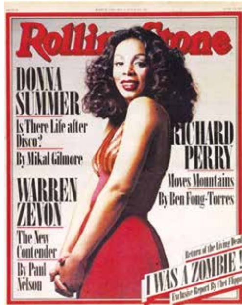
Figura 13: Donna Summer en la tapa de la revista Rolling Stone en 1978.