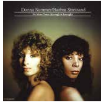
Figura 21: No More Tears (Enough is Enough) (“Ya no llores (es demasiado)”), canción de Donna Summer y Barbra Streisand, de 1979. El sencillo alcanzó el número 1 en las lista de sencillos en Estados Unidos y en el Reino Unido.

Con estos éxitos, Donna Summer alcanzó el inusual récord de ocho éxitos “top 5” en un plazo de apenas dos años. En 1979, lanzó su primera recopilación para la que aportó la nueva can-