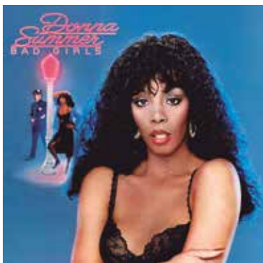
Figura 18: Bad Girls ("Chicas malas") es el séptimo álbum de Donna Summer, publicado en 1979. Comprende una variedad de géneros musicales, como disco, soul y rock.

plenamente de tanto éxito: cayó en etapas de ansiedad y depresión que le llevaron a consumir tranquilizantes y otros medicamentos adictivos. Más tarde debió recibir tratamientos de desintoxicación.