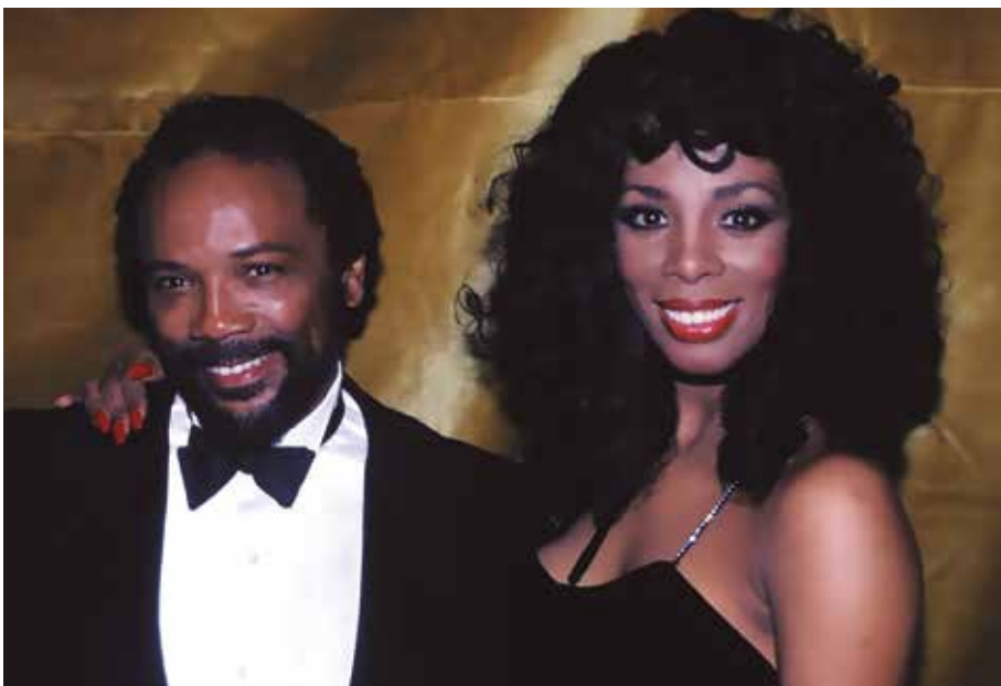
Figura 26: Donna Summer y Quincy Jones y en el Teatro Savoy de Nueva York en 1983.

Pero surgió un nuevo conflicto: la compañía PolyGram , propietaria del sello Casablanca , reclamaba a Donna la grabación de un nuevo álbum