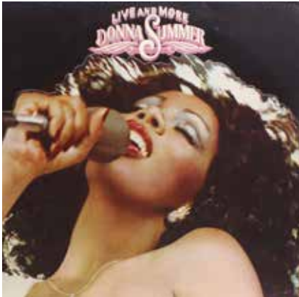
Figura 11: Live and More ("En vivo y más") es el primer álbum en vivo de Donna Summer y el segundo LP doble de la artista. Fue grabado en el Universal Amphitheatre de Los Ángeles en 1978, durante su gira Once Upon a Time Tour .