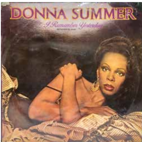
Figura 6: I Remember Yesterday (“Yo Recuerdo el Ayer”) es el quinto álbum de Donna Summer. Se convirtió en su tercer álbum consecutivo en alcanzar el número 1 en Italia y uno de los más exitosos de su carrera en el continente europeo.

En 1977 Donna Summer publicó I Remember Yesterday (Figura 6), un álbum conceptual que incluyó como canción estelar I Feel Love . La insistencia en temas de amor o sexo motivó que Summer fuese apodada “la Primera Dama del Amor”, lo que no era de su agrado. Por su belleza y por las sugerencias de sus canciones, Donna transmitía una imagen seductora y provocativa que no reflejaba su carácter real, más bien discreto. Sus canciones reinaban en las pistas de baile y se asociaban al desenfreno nocturno