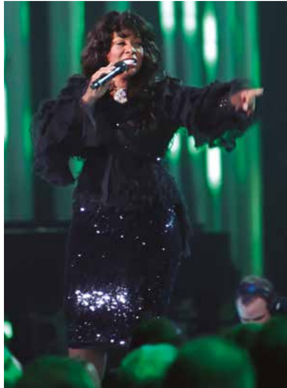
Figura 41: Donna Summer cantando en el concierto durante la entrega del Premio Nobel de la Paz al Presidente Barak Obama, en 2009.

El siguiente álbum, Crayons , en el que experimentaba con ritmos latinoamericanos, apareció en 2008 (Figura 40). En 2009 participó en el Concierto de la entrega del Premio Nobel de la Paz al presidente Barak Obama (Figura 41). En