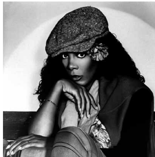
Figura 23: Fotografía publicitaria de Donna Summer de octubre de 1980 realizada por la Geffen Records .

ción On The Radio , cuya letra citaba el reciente éxito Love Is In The Air de John Paul Young. Este álbum doble llegó al número uno y la canción repitió el triunfo de entrar en el “top 5”.