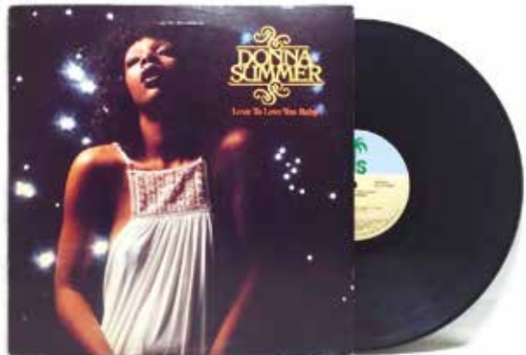
Figura 4: Love to Love You Baby (“Amo amarte bebé”) es el segundo álbum de Donna Summer, y el primero publicado internacionalmente.

prueba la canción haciéndola sonar en una de sus celebraciones. La reacción de los invitados fue tan entusiasta, que reclamaron que sonase una y otra vez. El directivo se puso en contacto con Moroder y Summer, anunciándoles que lanzaría la canción pero que necesitaba una versión extensa para el baile en discotecas. Recibió una versión de 17 minutos de duración, que no cabía en un disco de vinilo de tamaño sencillo y que tuvo que editarse en otro de 12 pulgadas: el maxi-sencillo, formato del que Donna Summer resultó ser pionera. A principios de 1976, Love to Love You Baby alcanzó el puesto Nº 2 en los Billboard Hot 100 de los Estados Unidos, mientras que el álbum del mismo nombre vendió más de un millón de copias (Figura 4).