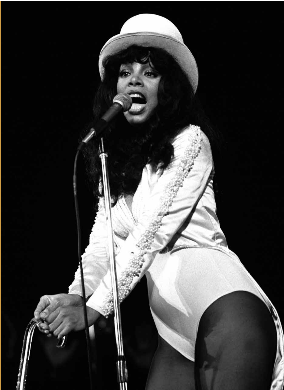
Figura 10 Donna Summer en una presentación en París en 1977.