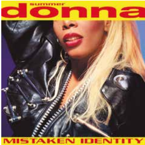
Figura 35: Mistaken Identity ("Identidad Perdida") es el decimoquinto álbum de Donna Summer, lanzado bajo el sello Atlantic en 1991. El álbum, al igual que sus sencillos, no tuvo éxito.