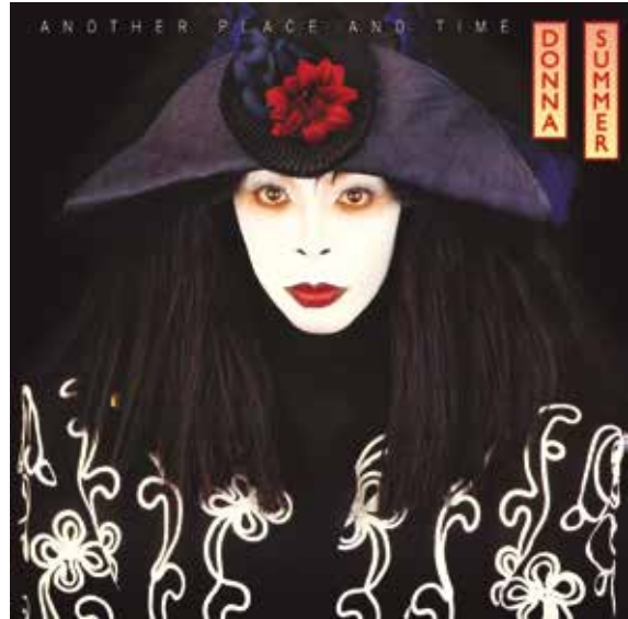
Figura 34: Another Place and Time ("Otro lugar y tiempo") es el decimocuarto álbum de Donna Summer, lanzado en 1989. El álbum fue producido por Stock Aitken Waterman y su canción más famosa fue This Time I Know It's For Real .

y la canción All Systems Go ni llegó a lanzarse en Estados Unidos, conformándose en el Reino Unido con el puesto 54 en las listas. Las dificultades de Summer aumentaron cuando se vio envuelta en una polémica periodística: se le atribuyeron unas declaraciones antihomosexuales relativas al SIDA que provocaron un alud de críticas. La cantante insistió en la falsedad de tales afirmaciones. A fin de relanzar la carrera de Donna, Geffen Records llamó a los productores ingleses Stock, Aitken y Waterman (conocidos como "el trío SAW"), entonces de moda (Figura 33). Se los consideraba infalibles como creadores de éxitos bailables (habían lanzado a Kylie Minogue, Rick Astley, Samantha Fox y otras figuras juveniles). Donna Summer y el trío SAW lanzaron el álbum Another Place and Time (Figura 34), cuyos principales éxitos fueron This Time I Know it's for Real y I Don't Wanna Get Hurt . Luego de un lanzamiento accidentado, This Time I Know It's for Real terminó siendo el 12° "single" de oro en la carrera de la cantante.