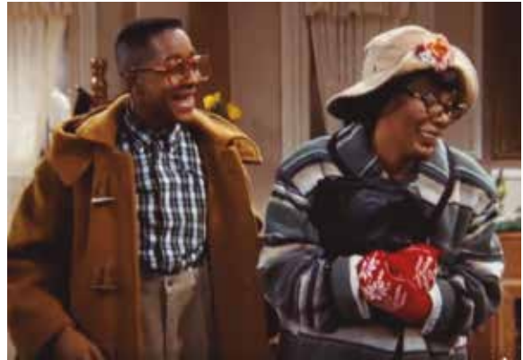
Figura 37: Donna Summer interpretando a la tía Oona en la serie estadounidense Family Matters (se tradujo al español como Cosas de casa ).

En 1999, se publicó un álbum de un recital que había dado en televisión con dos canciones extra, grabadas en estudio ( I Will Go With You y Love