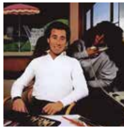
Figura 22: David Geffen y Donna Summer.