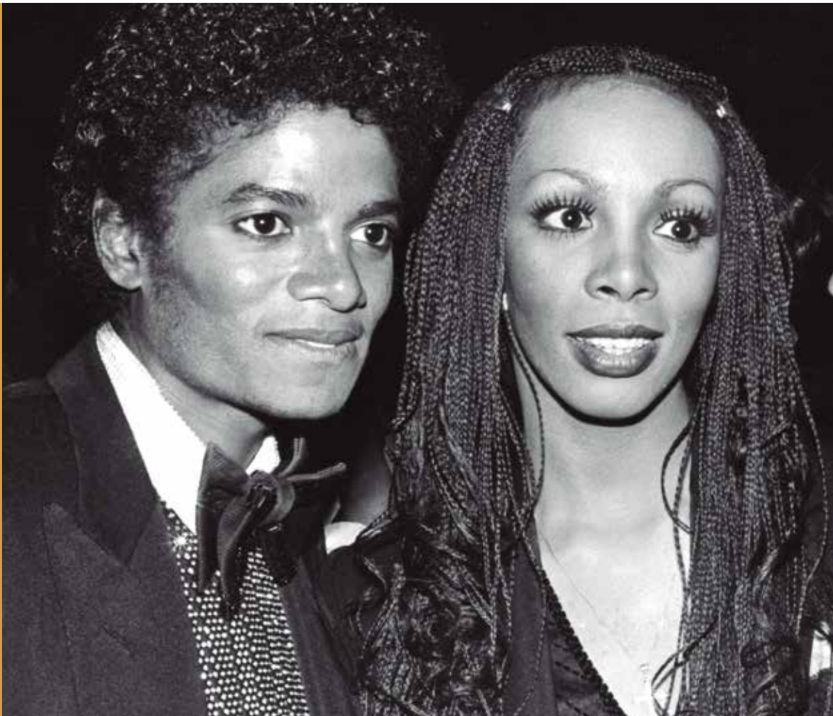
Figura 25 Donna Summer con Michael Jackson en 1982.