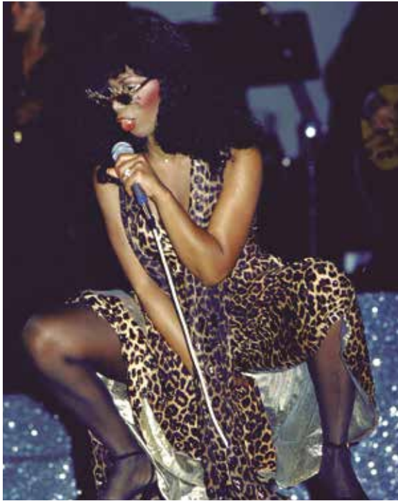
Figura 20: Donna Summer cantando en la entrega de los Premios Grammy de 1979.

se convirtió en su propia competidora ya que tanto Bad Girls como Hot Stuff se peleaban por el primer lugar en el “top 5” en los Estados Unidos.