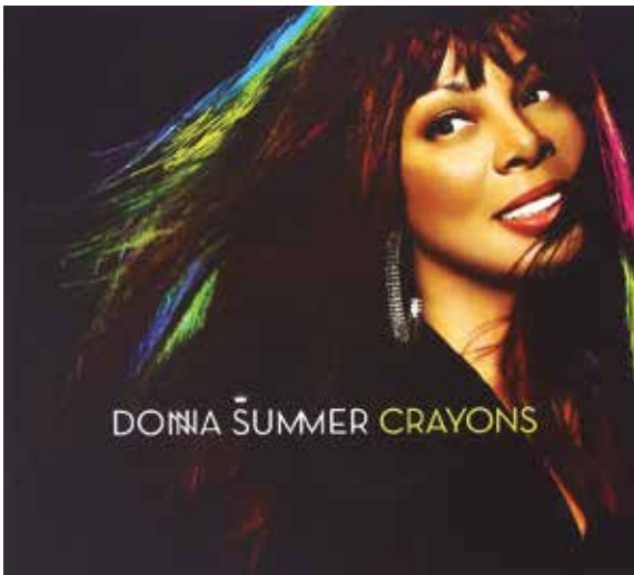
Figura 40: Crayons ("Pinturas") es el decimoséptimo y último álbum de estudio de Donna Summer, lanzado el 20 de mayo de 2008 en Estados Unidos.

El siguiente álbum, Crayons , en el que experimentaba con ritmos latinoamericanos, apareció en 2008 (Figura 40). En 2009 participó en el Concierto de la entrega del Premio Nobel de la Paz al presidente Barak Obama (Figura 41). En