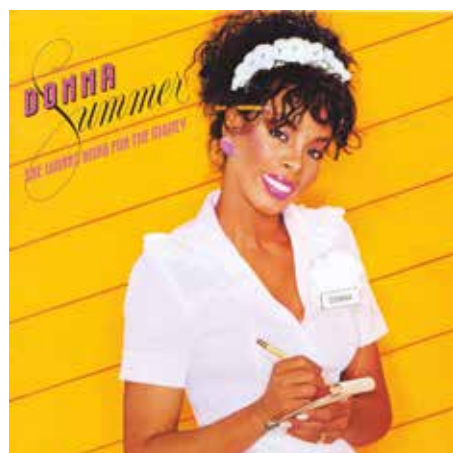
Figura 28: She Works Hard for the Money ("Ella trabaja duro por dinero") es el undécimo álbum de Donna Summer, publicado el 10 de mayo de 1983. Este álbum fue su mayor éxito de la década y produjo uno de los mayores éxitos de toda la carrera de Donna con la canción principal del mismo título, She Works hard for the money , que fue el mayor éxito de Summer desde 1979.