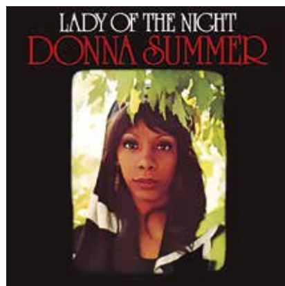
Figura 2: Lady of the Night ("Dama de la noche") fue el primer álbum de Donna Summer. Fue producido por Pete Bellotte, y lanzado solamente en los Países Bajos. Las canciones, escritas por el dúo Bellotte-Moroder, son en su mayoría de estilo folk , pop y soft rock , muy diferente al material presentado en su siguiente álbum de 1975 Love to Love You Baby .

A mediados de 1975, grabó la canción Love to Love You Baby , que incluía atrevidos jadeos y gemidos propios de un orgasmo. Para grabarlos pidió un ambiente íntimo, lo que hizo pensar que las sensaciones sugeridas en la canción