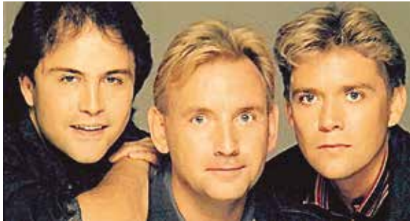
Figura 33: El trío Stock-Aitken-Waterman (SAW).