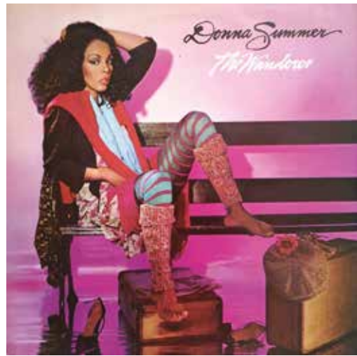
Figura 24: The Wanderer (“El Vagabundo”) es el octavo álbum de Donna Summer, y el primero lanzado bajo el sello Geffen, con el cual firmó contrato en 1980, año de su fundación.

en descrédito por saturación, y hubo gente que llegó a manifestarse destruyendo montones de “maxi-singles” con máquinas apisonadoras. Por otro lado, Donna renegaba de sus éxitos más sensuales, como Love to Love You Baby . Cuentan que se retiró de la vida nocturna propia del espectáculo y adoptó un fervor religioso casi puritano. Firmó contrato con Geffen Records , nuevo sello fundado por David Geffen (Figuras 22 y 23), y lanzó el álbum The Wanderer , ya con influencias de la new wave y el rock al modo de Pat Benatar (Figura 24). La canción del mismo título llegó al “top 3” en Estados Unidos y el álbum alcanzó por ventas un disco de oro. Luego, se preparó un segundo álbum, I’m a Rainbow , pero la com-