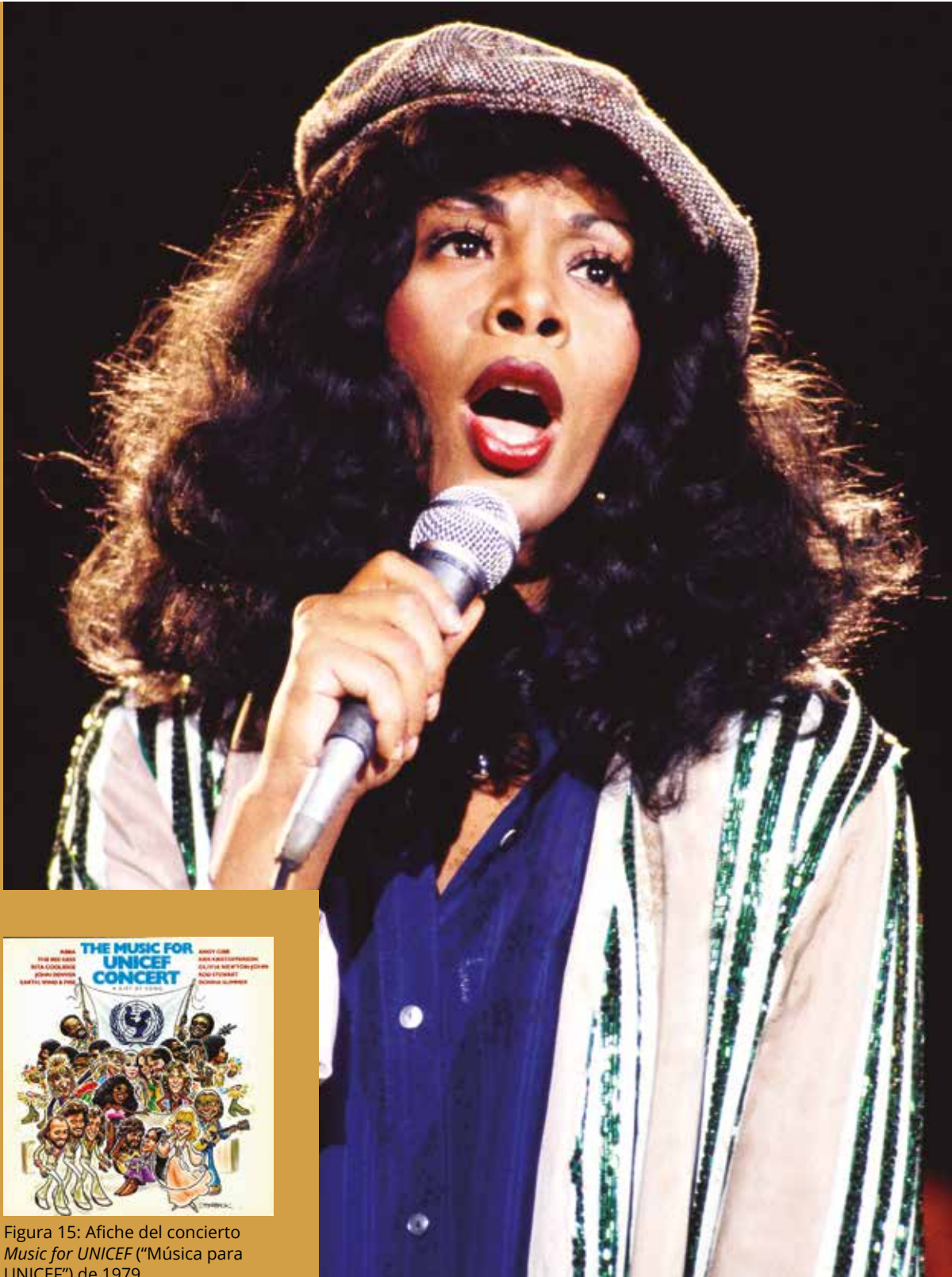
Figura 15: Afiche del concierto Music for UNICEF ("Música para UNICEF") de 1979.