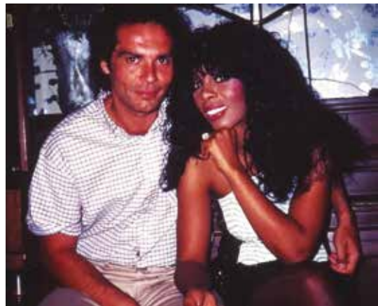
Figura 14: Donna Summer y Bruce Sudano.

primer álbum grabado en vivo, Live and More , que llegó a ser disco de platino en dicho país al vender un millón de copias (Figura 11).