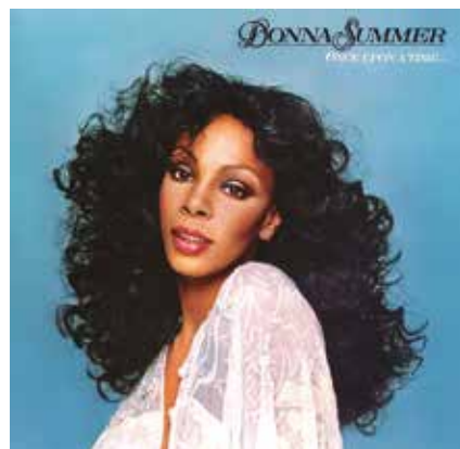
Figura 9: Once Upon a Time (“Había una vez”) es el sexto álbum de Donna Summer, y su primer LP doble. El álbum relata una versión moderna de la Cenicienta.