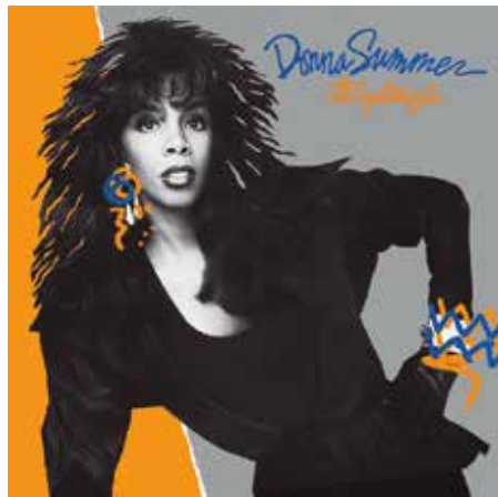
Figura 31: All Systems I ("Todos los sistemas listos") es el decimotercer álbum de la cantante Donna Summer, y el último bajo el sello Geffen.

a fin de liquidar su viejo contrato. La respuesta a tal demanda fue el álbum de 1983 She Works Hard for the Money , cuyo tema del mismo título llegó al "top 3" (Figura 28). Liberada ya de su relación con Casablanca Records y PolyGram , Donna Summer lanzó en 1984 el álbum Cats Without