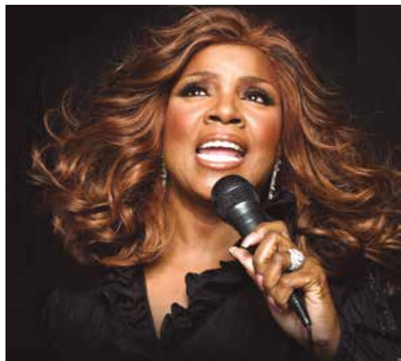
Figura 8: Gloria Fowles, conocida por su nombre artístico Gloria Gaynor, es una cantante de música disco y soul estadounidense, conocida por sus éxitos Never Can Say Goodbye (1974), I Will Survive (1978) y I Am What I Am (1983). Escribió su mayor éxito, I Will Survive (“Sobreviviré”), desde el punto de vista de una mujer que pudo alejarse de su amante seguir adelante sin él. La canción se convirtió en un himno de la liberación femenina.

Muy productiva, en el mismo año 1977, la cantante publicó un álbum doble inspirado en el