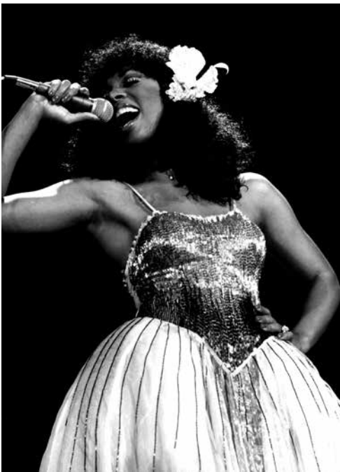
Figura 17: Donna Summer cantando en vivo en 1979.

En 1979, proclamado Año del Niño, la cantante participó en el concierto Music for UNICEF junto a estrellas como ABBA, Olivia Newton-John, Bee Gees y Rod Stewart (Figuras 15 y 16) Se codeaba con los más grandes. Pero no disfrutaba