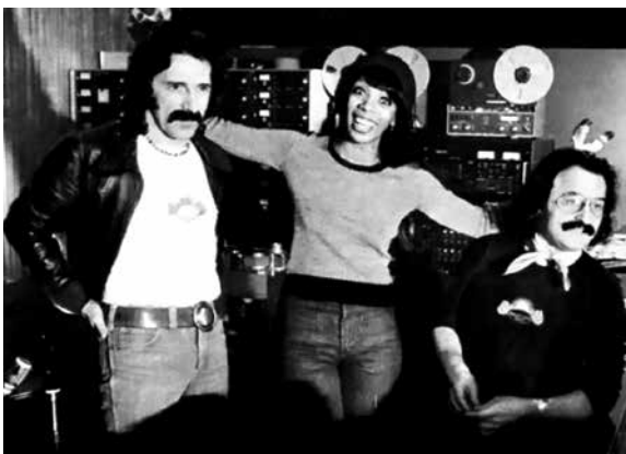
Figura 1: Pete Bellote, Donna Summer y Giorgio Moroder en Múnich.

Influida por la contracultura de la década de 1960, se convirtió en la vocalista de la banda de rock psicodélico Crow y se instaló en Nueva York. Inicialmente no tuvo el éxito esperado y se trasladó a Alemania, para reemplazar a Melba