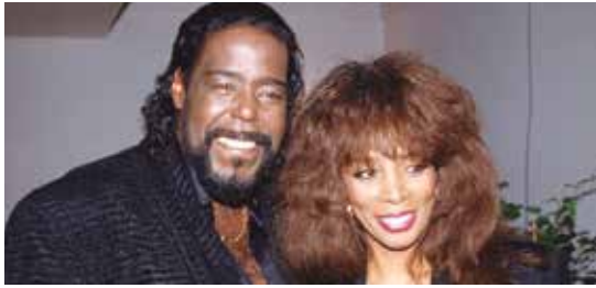
Figura 32: Donna Summer y Barry White en 1987.