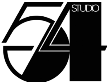
Figura 7: Studio 54 es un antiguo y popular club nocturno y discoteca del sector artístico neoyorkino de Broadway, ubicado en la Calle 54 Oeste en Manhattan, famoso a finales de los años 70s por ser frecuentado por celebridades de alto perfil de Estados Unidos y Europa.

de clubes como Studio 54 (Figura 7), pero ella siempre moderaba su vida social y rara vez trasnochaba. Esta fue la época dorada de la música disco. Donna desplazó a Gloria Gaynor quien, hasta ese entonces, ostentaba el título de “la reina de las discotecas” (Figura 8).