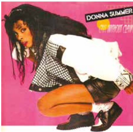
Figura 29: Cats Without Claws ("Gatos sin garras") es el duodécimo álbum de estudio de Donna Summer, lanzado en 1984 bajo el sello Geffen. Durante este período, Summer experimentó con varios estilos musicales, lo cual se vio reflejado en diferentes grados de éxito.

Donna Summer actuando en la gala inaugural en el Centro de Convenciones de Washington DC el 19 de enero de 1985.