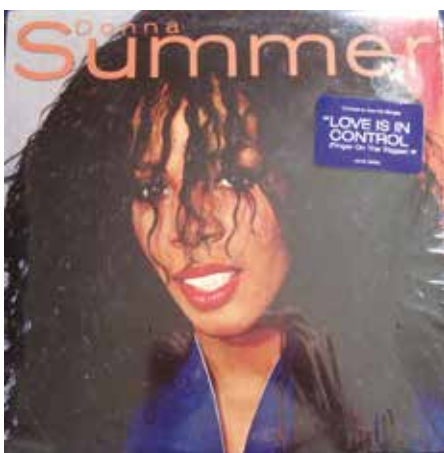
Figura 27: Donna Summer es el décimo álbum de estudio de Donna Summer, publicado el 19 de julio de 1982 por la compañía discográfica Geffen Records. Para este disco, por disconformidad de Geffen con el resultado del álbum anterior, Giorgio Moroder y Pete Bellotte son reemplazados como productores por Quincy Jones.